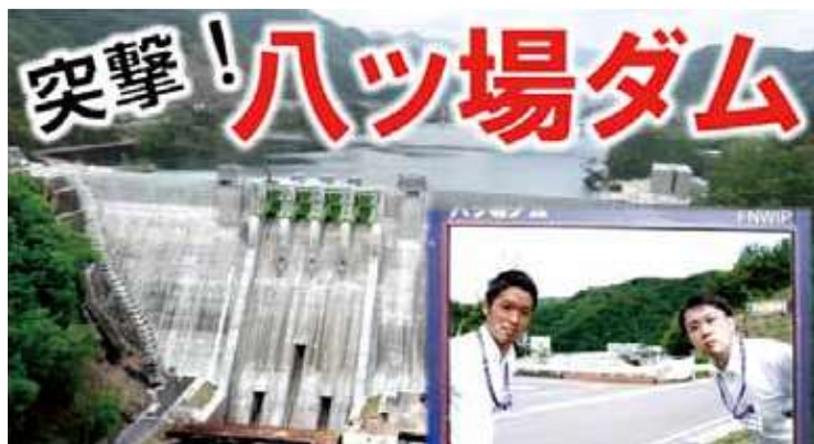
第1弾の動画 「ハッ場ダムに突撃レポート!」