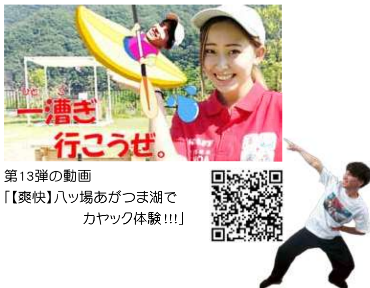
第13弾の動画 「【爽快】ハッ場あがつま湖で カヤック体験!!!」