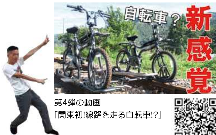
第4弾の動画 「関東初!線路を走る自転車!？」